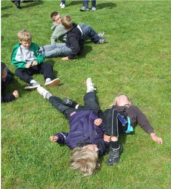
Otroligt viga barn, ena benet åt ett håll och det andra kvar på marken.