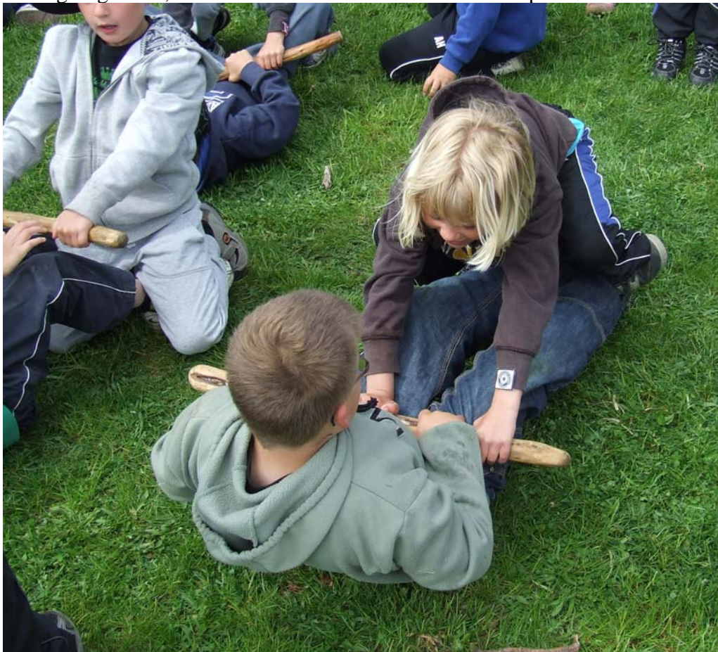
Dräg Hank är otroligt populärt ute på skolorna, mycket tack vare att oavsett kön så kan vem som helst vinna.